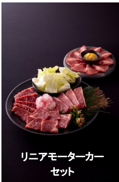
リニアモーターカー セット