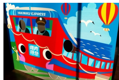
記念写真も可能なコロコロ募金箱※

※写真左上部の丸い穴にコインを入れると、盤面をコロコロと転がり落ちて、右下の募金箱に入る仕組み。募金は近隣の小・中学校に寄付する予定。