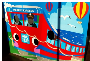
記念写真も可能なコロコロ募金箱※

※写真左上部の丸い穴にコインを入れると、盤面をコロコロと転がり落ちて、右下の募金箱に入る仕組み。募金は近隣の小・中学校に寄付する予定。