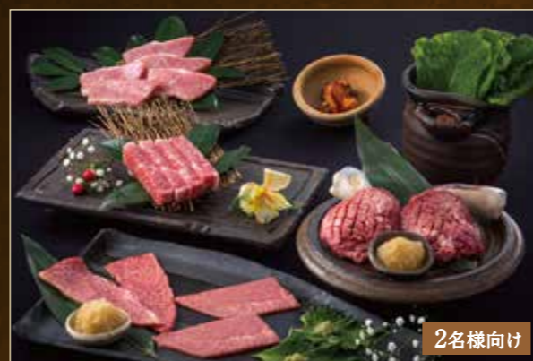
NEW 吟撰セット ¥7,980 (税込¥8,778)