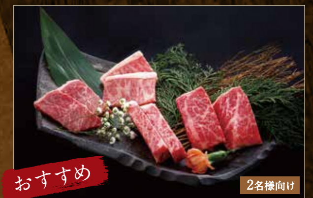
おすすめ 特選和牛4種盛 ¥2,980 (税込¥3,278)