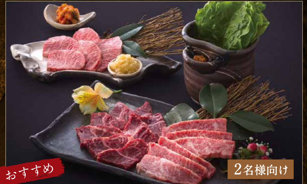
おすすめ 華セット ¥4,500 (税込¥4,950)