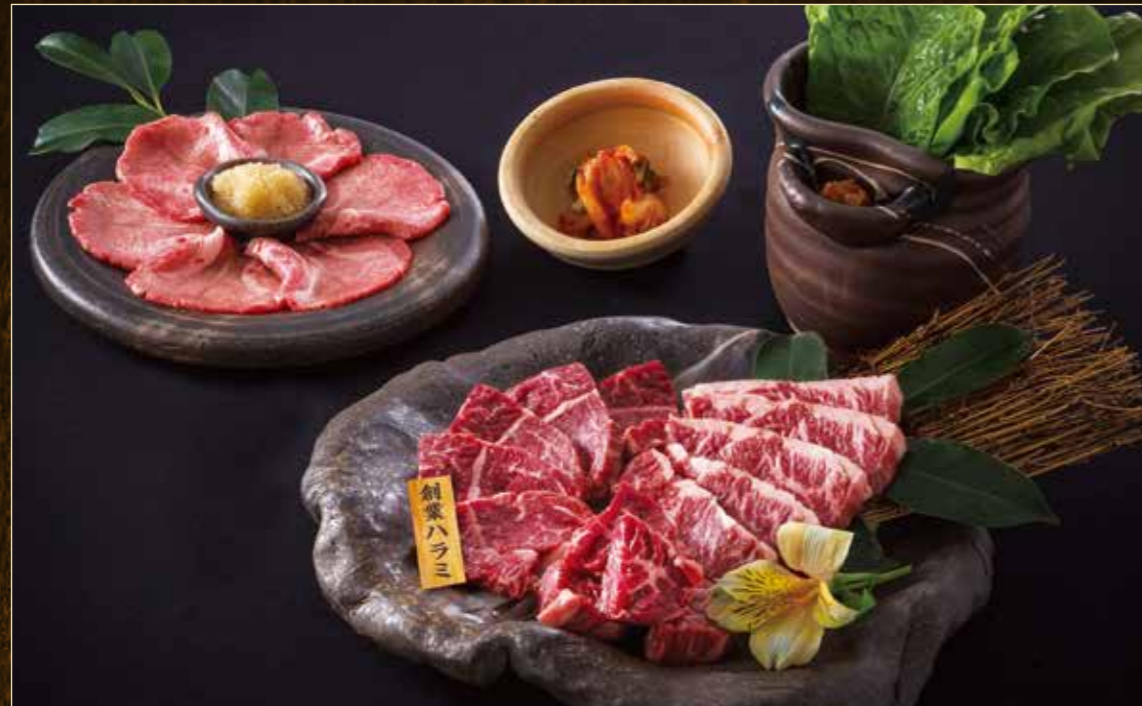
生上塩タン・ハラミセット ¥4,980 (税込¥5,478)

松屋が自信をもってお薦めするお肉をセットに。厳選された美味しさを存分にお愉しみください。