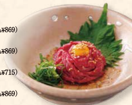
肉匠ユッケ (さくら)