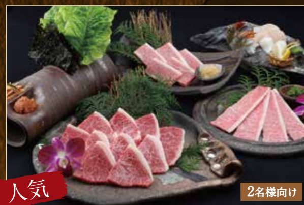
人気 上撰セット ¥6,980 (税込¥7,678)