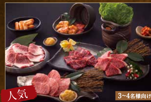
人気 和楽セット ¥5,980 (税込¥6,578)