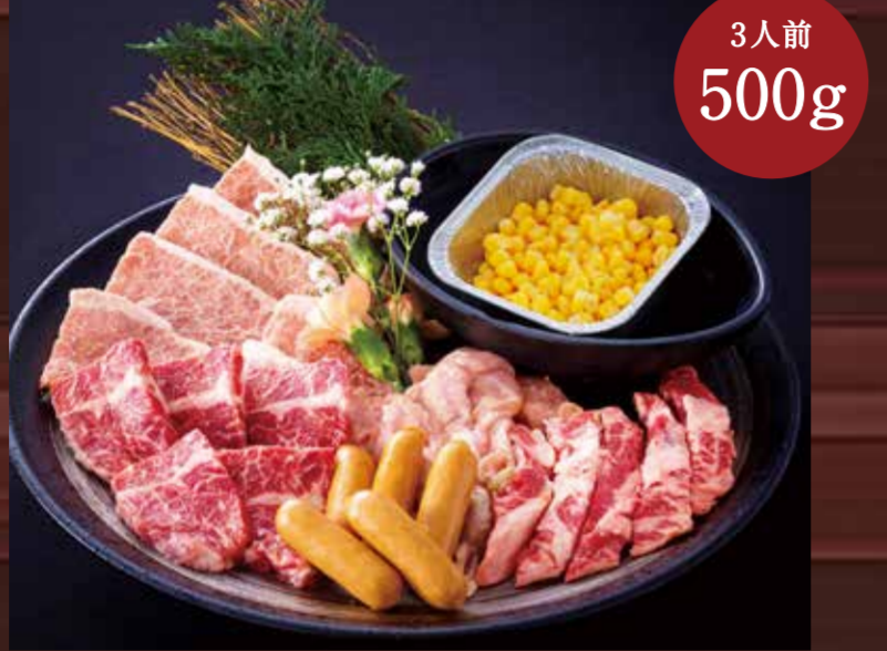
(ジューシーカルビ、ジューシーハラミ、中落ちカルビ、鶏のイトコドリ、ウインナー、コーンバター)