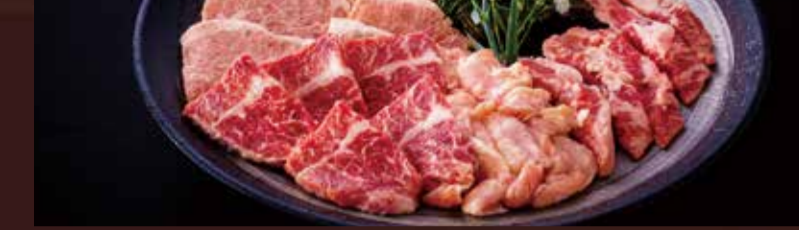
(ジューシーカルビ、ジューシーハラミ、中落ちカルビ、鶏のイトコドリ)