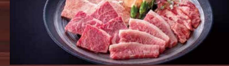
(和牛赤身の王様、和牛大トロカルビ、中落ちカルビ、ジューシーカルビ)